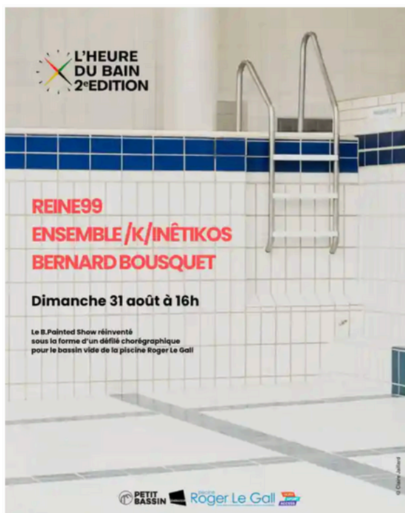
visuel l'Heure du Bain